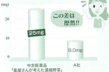
リコピン 含有量の比較

「薬屋さんが考えた濃縮野菜」は高濃度リコピントマトを使用し、1缶に25mgのリコピンの含有に成功。キレイをサポートする、女性にうれしい野菜ジュースです。